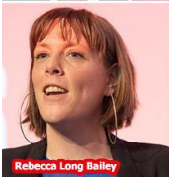
Rebecca Long Bailey