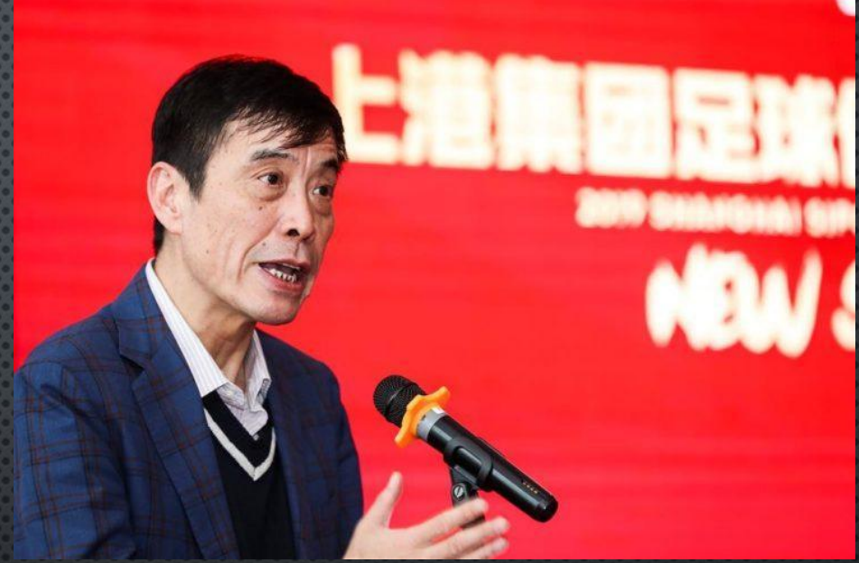
ÇIN FUTBOL FEDERASYON BAŞKANI ÇIN ŞÜİYEN