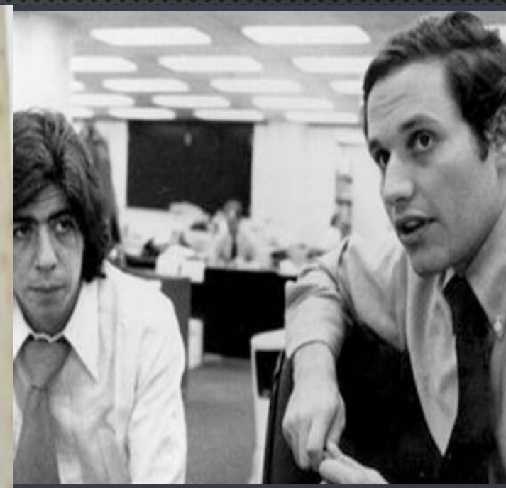
GAZETECILER BOB WOODWARD VE CARL BERNSTEIN...