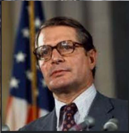
Elliot Lee Richardson (1920...

37. ABD BAŞKANI OLAN NIXON, ARCHIBALD COX İSİMLİ BİR SAVCIYI BU GÖREVE ATIYOR VE COX, BEYAZ SARAY'DA BAŞKANIN BÜTÜN KONUŞMALARIN TEYBE ALINDIĞINI ÖĞRENEREK BU KAYITLARININ KENDİSİNE VERİLMESİNİ İSTİYOR. BAŞKAN NIXON İSE BU İSTEĞİ REDDEDEREK COX'UN GÖREVDEN ALINMASINI EMREDİYOR. ADALET BAKANI RICHARDSON, COX'U GÖREVDEN ALMAYI REDDEDİNCE BASKAN NIXON, BU SEFER BAKAN RICHARDSON'IN GÖREVİNE SON VERİYOR.