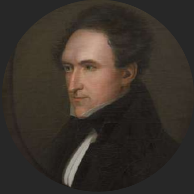
Carl Jonas Love Almqvist

İsveç'te 19. yüzyılda edebiyatın gelişimi, romantizm akımının etkisi altında gerçekleşti. Bu dönem, duygusallık, doğa sevgisi, halk kültürüne dönüş ve milliyetçilik gibi romantik temaların vurgulandığı bir dönemdi. Bazı İsveçli yazarlar, bu romantik idealleri eserlerinde işlediler. İsveç'in bu dönemdeki edebi figürlerinden bazıları şunlardır: