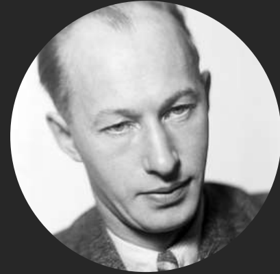
Erik Gustaf Geijer