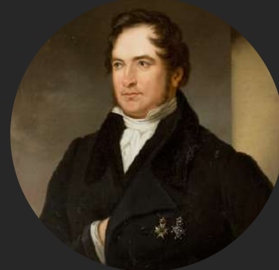
Erik Gustaf Geijer

Almqvist, İsveç romantizminin önde gelen isimlerinden biriydi ve halk hikayelerini ve doğal güzellikleri konu alan eserleriyle tanınır.